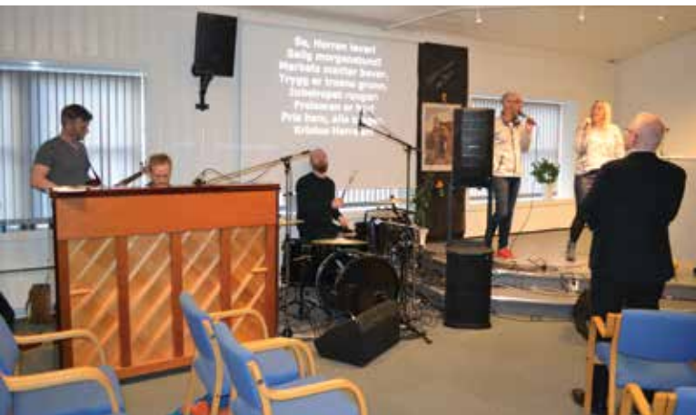
Musikkarar og forsongarar.