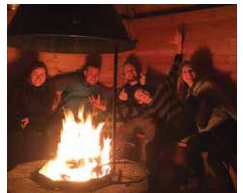
Kos rundt leirbålet.