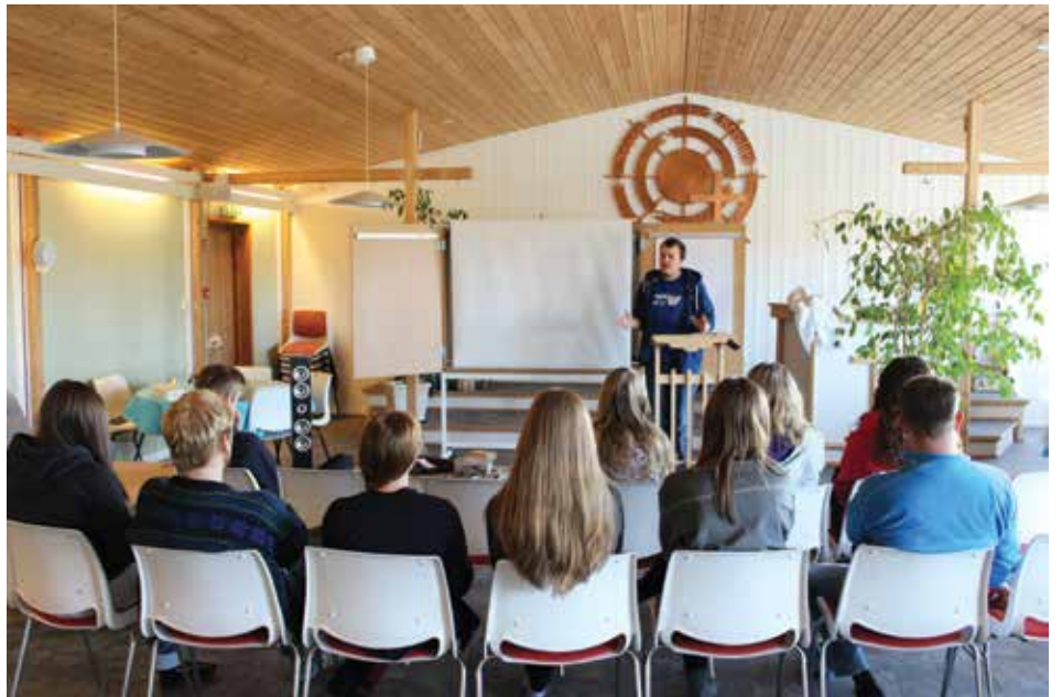
Leir på Ungdomssenteret i Vestre Jakobselv.