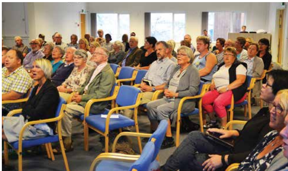
Bra fram møte på inspirasjonssamlingane