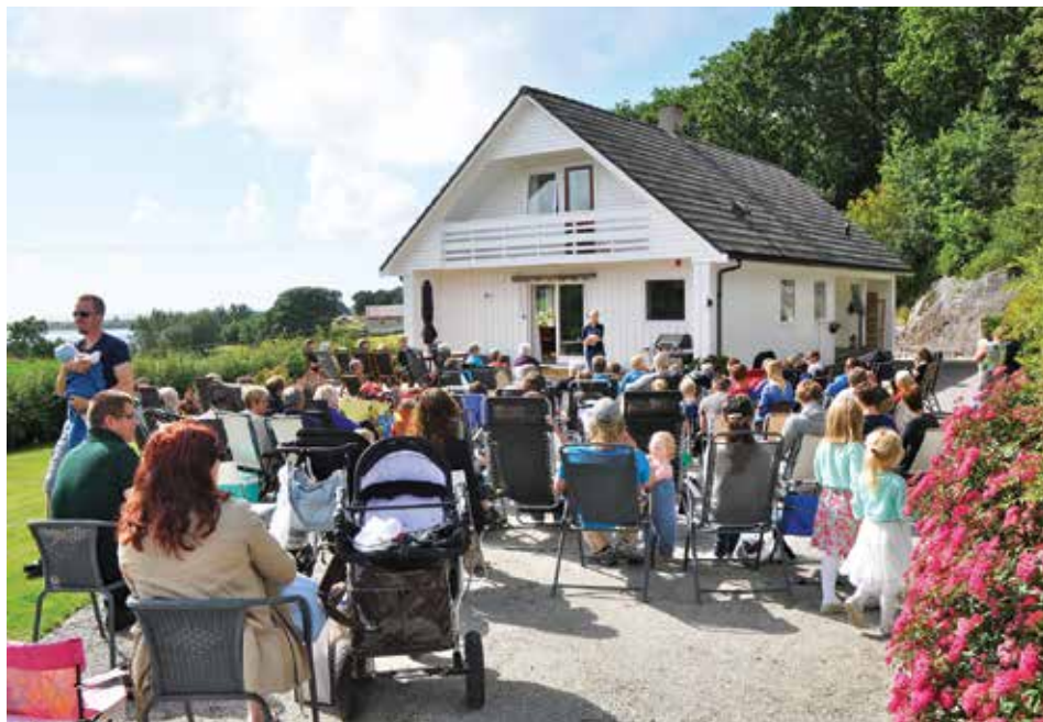
Flott frammøte i det gode været