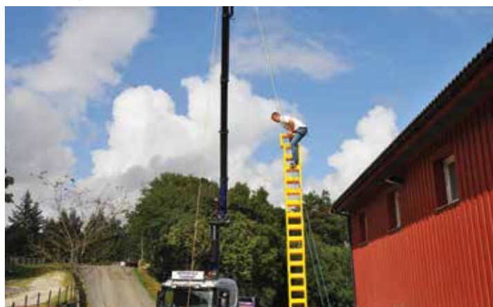
Fleire prøvde seg på bruskassestabling.