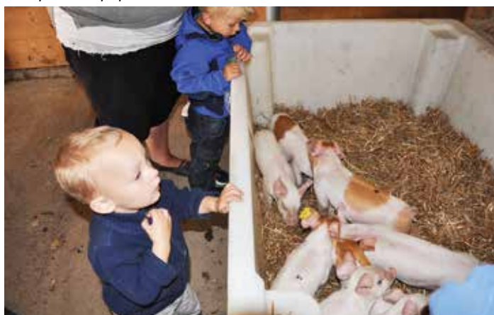
Mange barn falt for dei søte små grisungane.