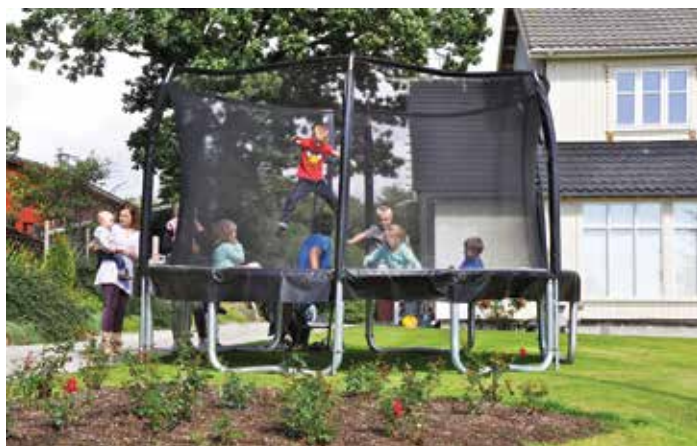
Trampoline er populært