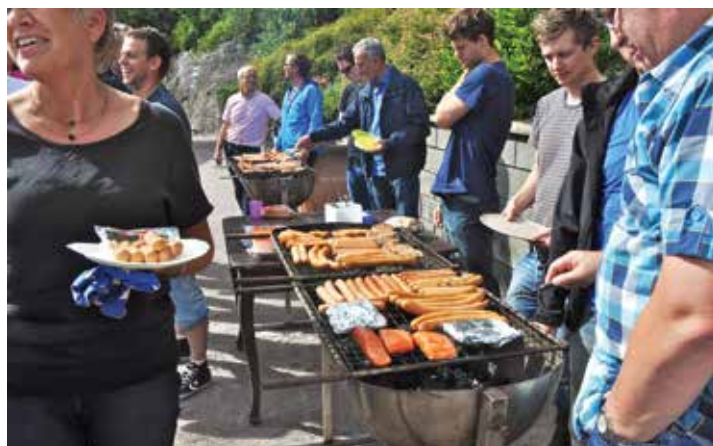
Grillmat høyrer med