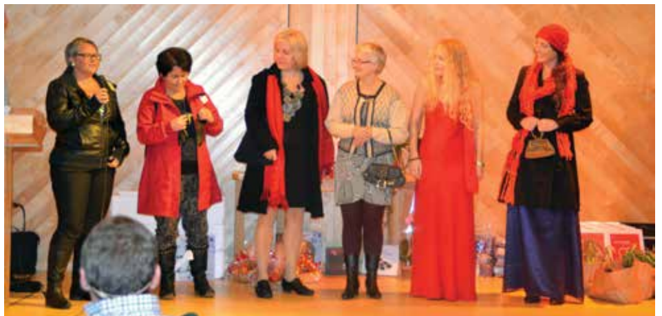
Julemessa, brukte dameklær.

fram på podiet flott kledde opp med brukte klær som var innlevert. Eit eige brukt sal var og med på å gje fleire tilbud under messa.